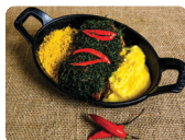
Castelina Mineira: castelina suína ao molho de melão de cana, acompanhada de polenta com queijo e críspis de couve

Os eleitos de cada circuito recebem a visita de outros jurados, que elegem então o Melhor Buteco do Brasil. O campo é revelado em julho.