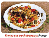
Frango que o pai atropelou: Frango servido na cama de purê de batata com molho de tomate e especiarias. Acompanha queijo minas gratinado, tomate confit, pesto de manjericão e torresmina de frango