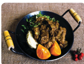
Castelina lambuzada: castelina de porco refogada na cebola, acompanhada de purê de banana da terra e almeirão