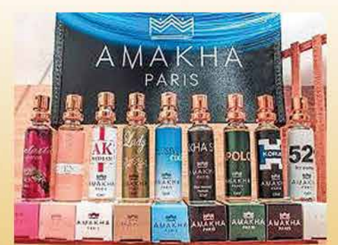
Perfumes de 15ml por apenas R$35

Garantia de Satisfação Fixação de 48 horas