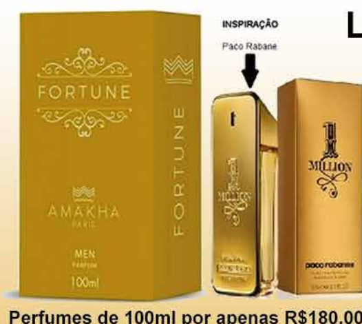
Perfumes de 100ml por apenas R$180,00

LIGUE AGORA: 3327-9608 e faça seu pedido SEM TAXA DE ENTREGA