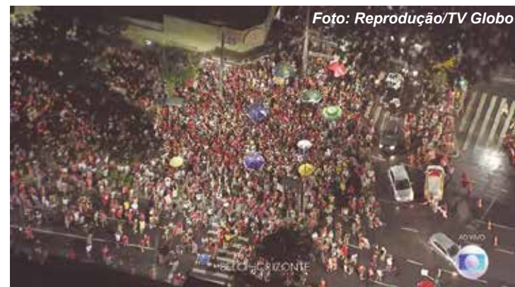
Festa também reuniu eleitores e apoiadores de Lula (PT) em Belo Horizonte

Lula ficou com 50,90% (60,3 milhões de votos), e Bolsonaro, com 49,10% (58,2 milhões de votos). Desde que as eleições presidenciais livres foram retomadas, em 1989, essa é a menor diferença tanto