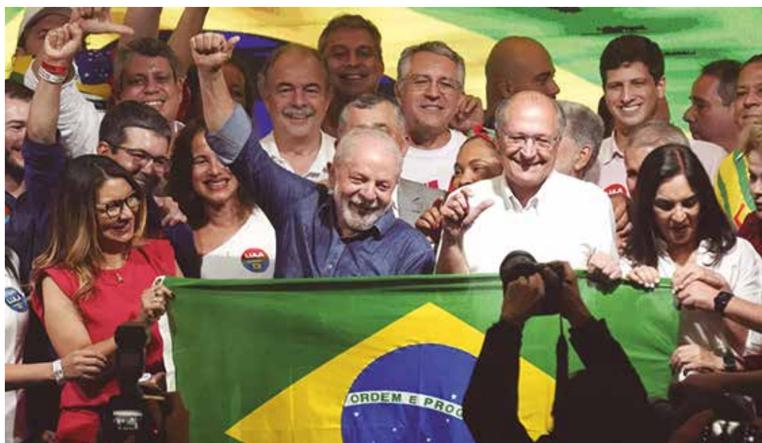
Lula com a bandeira do Brasil após discurso da vitória em São Paulo

Após a disputa mais acirrada desde a redemocratização e uma campanha turbulenta, marcada por uma guerra suja nas redes sociais, batalha religiosa e episódios de vio-