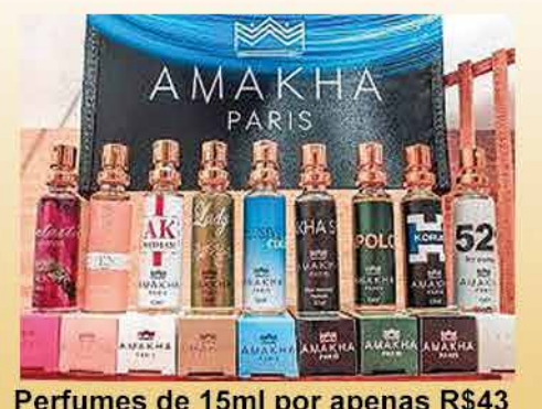
Perfumes de 15ml por apenas R$43

Venha se cadastrar e levar sua mercadoria para venda!