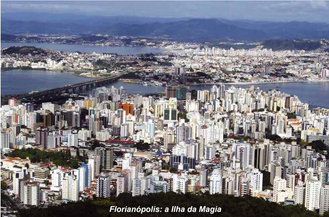
Florianópolis: a Ilha da Magia

Que tal se planejar para curtir praias maravilhosas na Ilha da Magia? Isso mesmo! Florianópolis é uma ilha composta de 42 praias, cada uma melhor e mais bonita que a outra. Confira!