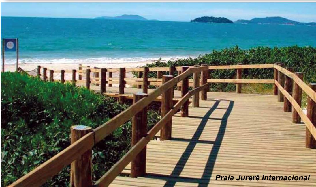
Praia Jurerê Internacional